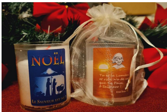
Opération Bougie de Noël Élise, cliché de Anne Silberstein.

Pour la fête de Noël 2020, une opération Bougie de Noël Élise a été lancée. À la sortie de la messe de Noël, des bougies ont été offertes aux paroissiens. Ce petit présent, avec l'effigie d'Élise et un court message, a remporté un vif succès à Mailly-le-Château.