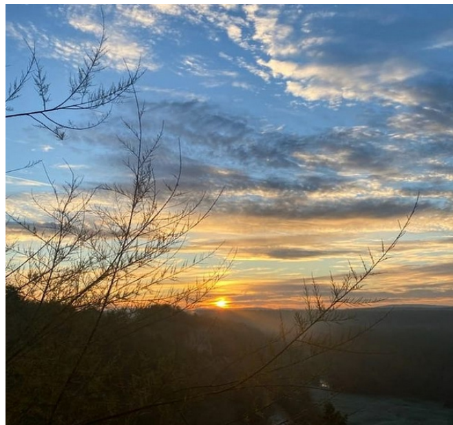
Soleil d'hiver sur les hauteurs de Mailly-le-Château.