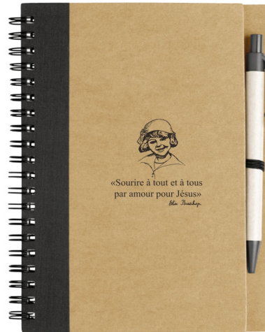
Bloc note Élise, maquette de Lionel Silberstein.

peut-être même s'inspirer des poèmes ou de la vie d'Élise.