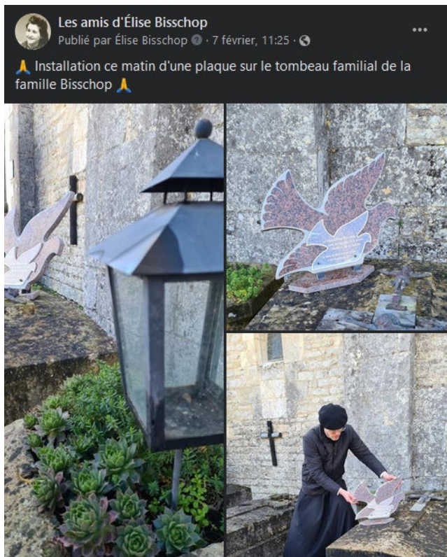
Une actualité sur notre page Facebook.

serions très heureux de vous compter comme nouveaux abonnés à nos pages. Sur Facebook et Instagram, nous sommes : Les Amis d'Élise Bisschop. N'hésitez pas à partager et à commenter notre actualité.